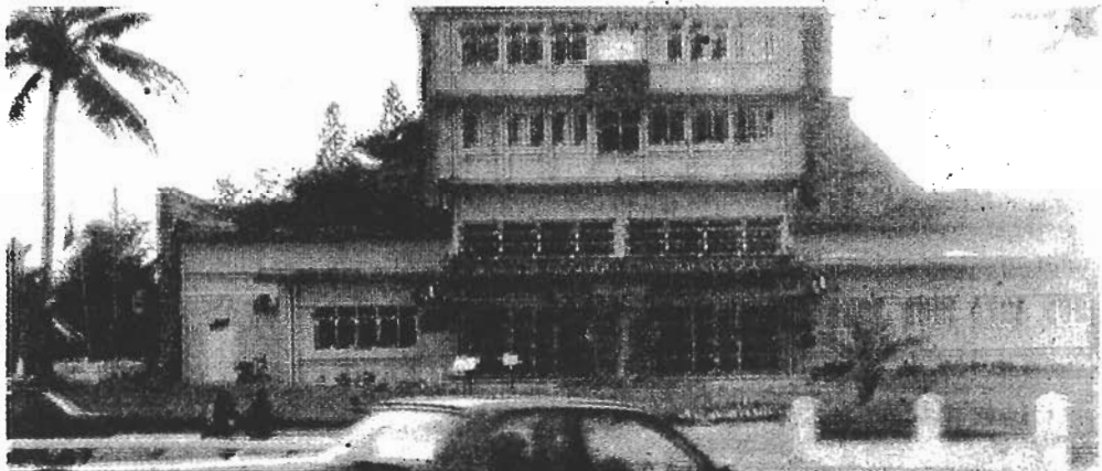
Toutes les activités de développement appuyées par QMM font l'objet d'une concertation avec les autorités locales, communales et régionales.

Pour l'acquisition de biens et de services, elle est exemptée de